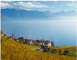
La Côte – la Riviera vaudoise La Côte – die waadtländische Riviera

38 communes viticoles et 620 hectares de vignes baignées par le soleil donnant plus de 200 vins différents s'étendent à